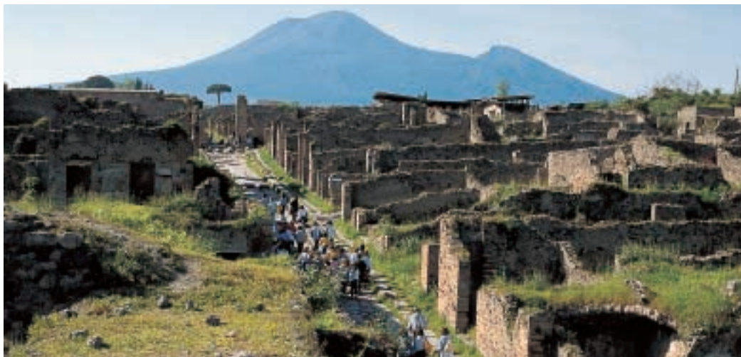
Il Vesuvio e gli scavi di Pompei

Le città più importanti del sud dell'Italia sono Napoli , Bari e Palermo .