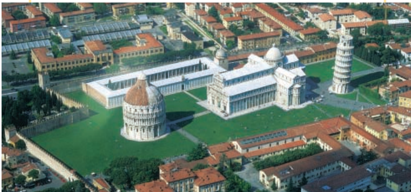
Campo dei Miracoli a Pisa

A sud l'Italia è formata dalla penisola meridionale e da due grandi isole: la Sicilia e la Sardegna .